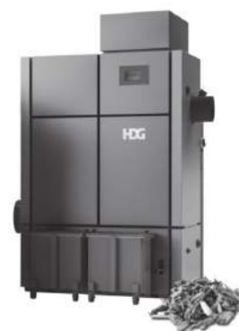
Hackschnitzelkessel von 25-800 kW

Weitere Termine und Anmeldung unter Tel. 08724/897-0