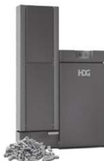
Pelletkessel von 10-800 kW