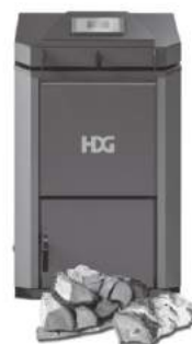
Scheitholzkessel von 15-60 kW