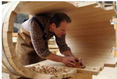
Ein Badezuber aus Eichenholz entsteht.

stimmungsvolle Bilder von Orten, die mit dem Können der Handwerker neu gestaltet wurden. Die einzigartigen Fotografien kann man ab dem 16. März im Freilichtmuseum Massing bewundern. „LandHandwerk“ heißt die Sonderausstellung. Zu sehen sind über 40 Prints, die nicht nur die traditionellen Gewerke zeigen, sondern auch die Liebe der Handwerker zu ihrer Arbeit und den Dingen, die sie machen, widerspiegeln. Fassbinder, Drechsler oder Wachszieher sind nur einige der Berufe, die auf eine lange Tradition zurückblicken und heute selten geworden sind. Auf dem Land versorgten sie einst die Bevölkerung mit wichtigen Gütern für den täglichen Bedarf. Hier sind Menschen zu sehen, die diese Tradition in die Gegenwart gerettet haben. Fotografenmeister Gerhard Nixdorf aus Burghausen hat bei seinen Reportagen Handwerke dokumentiert, den Meistern aus dem südlichen Bayern und dem Alpenraum über die Schulter geschaut und sehenswerte Fotoserien geschaffen. Die ästhetischen Bilder mit ihren Detailaufnahmen zeigen neben den Porträts der Handwerksmeister eindrucksvoll, wie in manueller Fertigung alltägliche und seltene Produkte geschaffen werden. Die Ausstellung „LandHandwerk“ läuft vom 16. März bis 16. Juli 2017. Weitere Informationen zum Jahresprogramm und zur Ausstellung im Freilichtmuseum Massing gibt es im Internet unter www.freilichtmuseum.de oder telefonisch unter 08724. 9603-0.