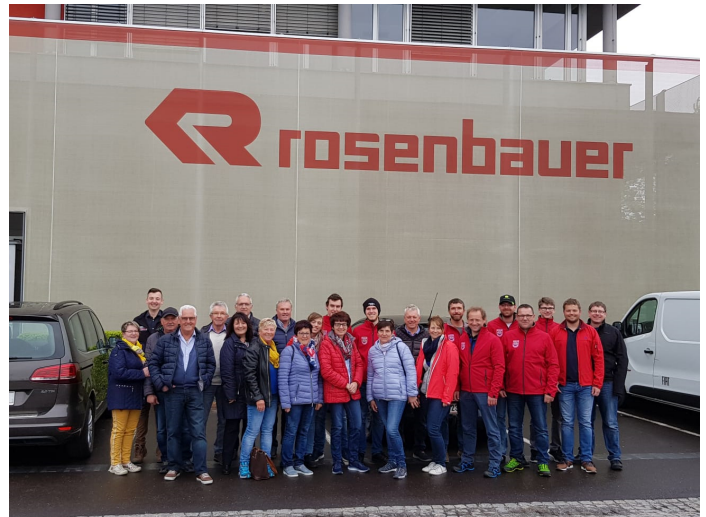
Werksbesichtigung bei der Firma Rosenbauer.