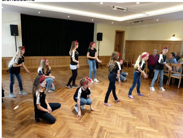
2. Legten einen schwungvollen Auftritt hin: Die G-City-Dancers aus Geratskirchen