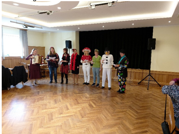
Hatten Probleme mit dem „Na song“: Die Damen des Familiengottesdienstteams