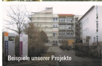
Beispiele unserer Projekte